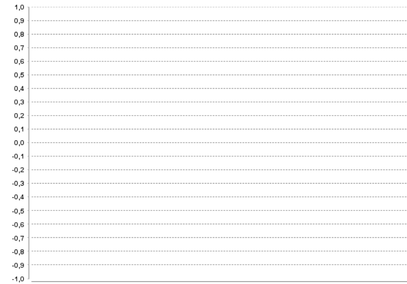
— Cotización (Primer valor calculado en base 100)