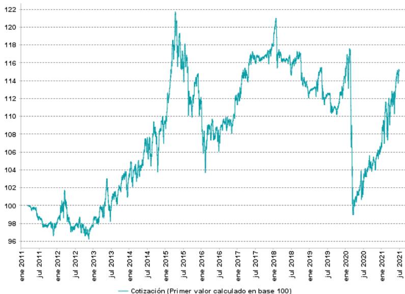
Cotización (Primer valor calculado en base 100)