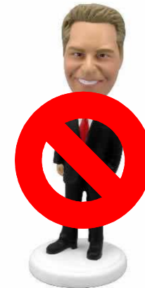
Administrador / Gestor